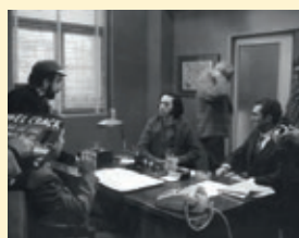
Rodaje de "El crack".