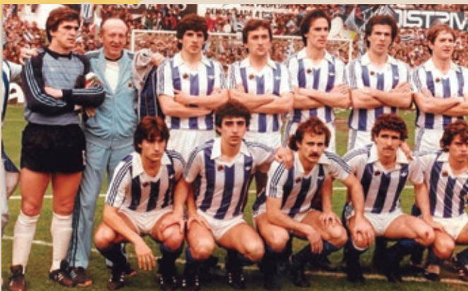
La Real Sociedad.

En el Madrid, que en 1981 llegó a la Final de la Copa de Campeones de Europa, pero la perdió contra el Liverpool, jugaban Agustín, García Cortés, Camacho, Vicente Del Bosque, Uli Stielike, Juanito, Carlos Santillana o Laurie Cunningham, siendo Vujadin Bošković el entrenador. Fue aquel que hizo célebre su sabia teoría futbolística: "Fútbol es fútbol".