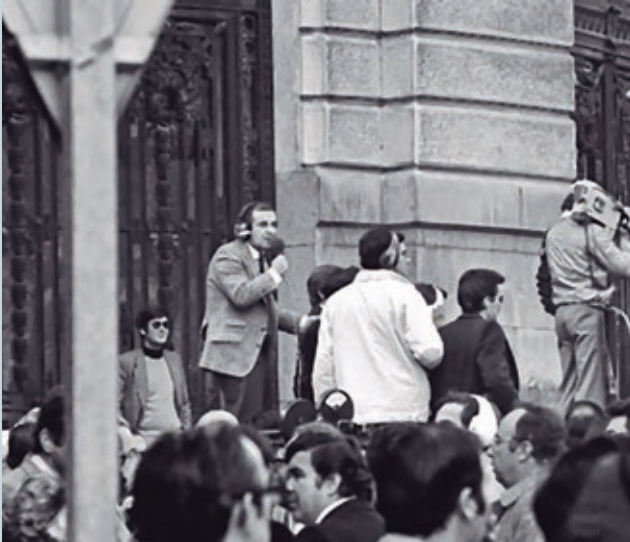
José M a García, el 23-F.

14%, con casi dos millones de parados y una población empleada cercana a los 12 millones de personas. La tasa de paro juvenil superaba el 30% ya a comienzos de los 80. La población era entonces de 37.881.873 personas (18.591.423 hombres y 19.290.449 mujeres).