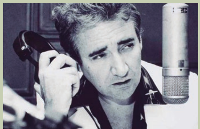
Luis del Olmo.

Unos días después del 23-F nacería en RNE otro programa que llegaría a ser histórico, Directo Directo , presentado por Alejo García. Y en las noches reinaba en la SER el ya citado José María García, que nos ilustraba, "¡Ojo al dato!", sobre los